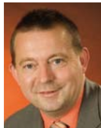
Stefan Mörsdorf , Saarländischer Minister für Umwelt

► Seit 1995 besteht der Umweltpakt Bayern, die erste beispielgebende Vereinbarung zwischen einem Bundesland und den ansässigen Wirtschaftsverbänden. Im Umweltpakt sind Erleichterungen insbesondere für EMAS-Teilnehmer vorgesehen. Seit 25.10.2005 gilt der fortgeschriebene Umweltpakt II. ■ Umweltpakt Bayern: www.stmugv.bayern.de/umwelt/wirtschaft/umweltpakt/index.htm