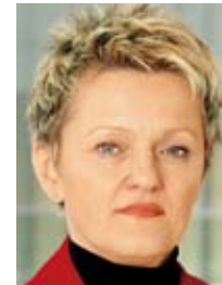
Renate Künast , Fraktionsvorsitzende Bündnis 90 / Die Grünen

Mit weiteren ressourcensparenden Maßnahmen werden wir unsere Fraktionsarbeit künftig noch ökologischer gestalten und würden uns freuen, wenn wir mit unserer Initiative für die EMAS-Validierung im Land Bremen weitere Nachahmer/innen finden. ■