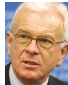
Prof. Dr. Hans-Gert Pöttering, Präsident des Europäischen Parlaments

terentwicklung, die unbürokratisch ist sowie den aktuellen staatlichen und betrieblichen Belangen der Nachhaltigkeit und des Umweltschutzes Rechnung tragen. Als Umweltpolitikerin werde ich mich dafür einsetzen. ■