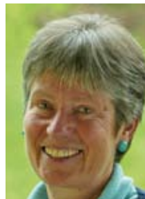
Dr. Angelika Zahrnt, Ehem. Vorsitzende und heutige Ehrenvorsitzende des Bund für Umwelt und Naturschutz Deutschland e.V. - BUND

Ich wünsche mir daher für die Zukunft, dass durch verbindlichere Umweltkennzahlen ein kontinuierlicher Verbesserungsprozess sicher und transparent gestaltet werden und einen Vergleich mit anderen Unternehmen innerhalb einer Branche ermöglichen. ■