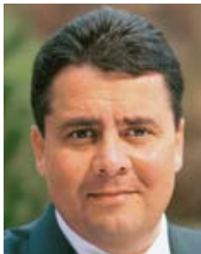
Sigmar Gabriel, Bundesminister für Umwelt, Naturschutz und Reaktorsicherheit

„Unser Ziel ist es, die deutsche Umweltpolitik vor dem Hintergrund nationaler, europäischer und globaler Aufgaben im Umweltschutz ständig fortzuentwickeln. EMAS als das hochwertigste auf dem Markt vorhandene Umweltmanagementsystem hilft uns dabei, unsere Umweltleistung in jeder Hinsicht zu verbessern