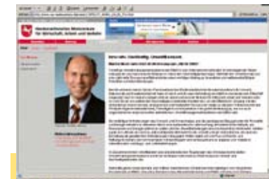
Statement des Ministers auf der Internetseite des Niedersächsischen Wirtschaftsministeriums.

Im Zusammenwirken mit effizienten und unbürokratischen Regelungen des Ordnungsrechts stellen Umweltmanagementsysteme somit ein wichtiges Instrument zur