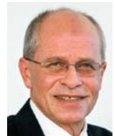
Berthold Huber, 1. Vorsitzender der Industriegewerkschaft Metall – IG Metall

Seitens der IG BCE werden im Rahmen der Bildungsarbeit u. a. Schulungen zum Umweltschutz, bei denen EMAS ein Bestandteil ist, für Betriebsräte bundesweit, aber auch regional angeboten. Aber auch die Gremien auf sozialpartnerschaftlicher Ebene, haben in den vergangenen Jahren mit entsprechenden Veranstaltungen zu mehr Wissen über EMAS beigetragen. ■