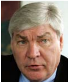
Michael Sommer, Vorsitzender des Deutschen Gewerkschaftsbundes – DGB

Ich unterstütze EMAS bei der Erschließung betriebswirtschaftlicher Kostensenkungspotenziale im betrieblichen Umweltschutz, denn wir brauchen zukünftig nicht nur eine Steigerung der Arbeitsproduktivität sondern auch eine Steigerung der Energie- und Ressourcenproduktivität. Material-, Energie- und Ressourceneffizienz sollten von den Unternehmen stärker als innovative Optionen von EMAS zur Verbesserung der Wettbewerbsfähigkeit erkannt und ausgeschöpft werden. Aus meiner Sicht kann EMAS so auch einen Beitrag zur Entlastung des Faktors Arbeit leisten und Anreize für Umwelt und Beschäftigung geben.