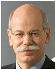
Dr. Dieter Zetsche, Vorsitzender des Vorstandes der Daimler AG

Nur was man umfassend prüft, kann man auch nachhaltig verbessern. Deshalb setzen wir bei Daimler seit langem auf Umweltmanagement- und Auditsysteme wie EMAS. Sie tragen dazu