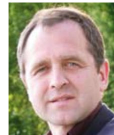
Dr. Reinhard Loske , Senator für Bau, Umwelt, Verkehr und Europa der Freien Hansestadt Bremen

Der Umweltpakt Saar, 2002 aus der Taufe gehoben, ist eine Vereinbarung zwischen Landesregierung und Wirtschaft für bessere wirtschaftliche Rahmenbedingungen und mehr Umweltschutz. ■