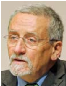
Hubert Weinzierl, Präsident des Deutschen Naturschutzring e.V. - DNR

Das Umweltmanagementsystem EMAS kann als freiwillige Maßnahme und in Ergänzung zum Umweltrecht zu Verbesserungen des Umweltschutzes in Betrieben und anderen Organisationen führen.