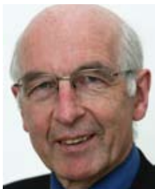
Dr. Hermann Barth , Präsident des Kirchenamtes der Evangelischen Kirche Deutschland - EKD

Als kirchliche Einrichtung, die umfassende Hilfen für hörgeschädigte, mehrfach behinderte Menschen aller Altersstufen anbietet, steht gerade die Bewusstseinsbildung der bei uns lebenden Menschen im Mittelpunkt. Deshalb finden auch regelmäßig umweltpädagogische Aktivitäten, wie Ausstellungen oder Kulturveranstaltungen zum Thema statt. ■