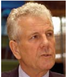
Dr. Volker Hauff , Vorsitzender des Rates für Nachhaltige Entwicklung der Bundesregierung

Heute gilt mehr denn je: Nachhaltigkeit und Innovation bestimmen die Zukunftsfähigkeit jedes Unternehmens. Dass wir heute verschiedene Ansätze zum Umweltmanagement haben, ist auch ein Erfolg von EMAS.