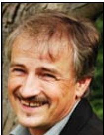
Olaf Tschimpke, Präsident des Naturschutzbund Deutschland e.V. – NABU

Mit seiner Teilnahme an EMAS will der BUND seinen Anspruch an Umweltschutz gegenüber anderen und sich selbst dokumentieren, sich kontinuierlich internen und externen kritischen Prüfung unterziehen und auf diese Weise glaubhaft und ohne nachzulassen an einer zukunftsfähigen, nachhaltig umweltgerechten Entwicklung mitzuarbeiten. ■