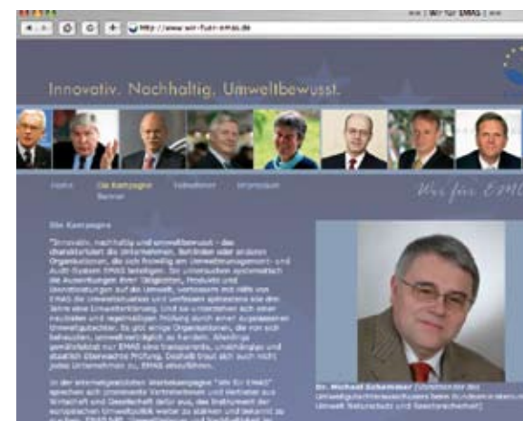
Von Juli 2007 bis Anfang 2008 im Netz: Die Internetkampagne „Wir für EMAS“

Alle EMAS-registrierten Unternehmen und Organisationen sind im elektronischen Register des DIHK unter www.emas-register.de verzeichnet