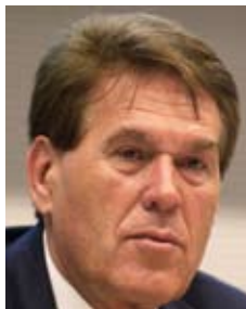
Michael Glos, Bundesminister für Wirtschaft und Technologie

Deshalb hat sich das Umweltbundesamt dieser Herausforderung schon früh gestellt und auf allen innerbehördlichen Ebenen dafür gesorgt, dass die Maßstäbe der EMAS-Verordnung in all ihren Konsequenzen in unserem Hause praktiziert werden. Begonnen haben wir an unseren Standorten in Berlin-Grünwald und Langen (Hessen). Und an den Dienstsitzen in Dessau und Berlin-Mariefelde haben wir gerade die Validierungsaudits erfolgreich hinter uns gebracht. Dort stehen wir kurz vor der Registrierung als EMAS-Teilnehmer. ■