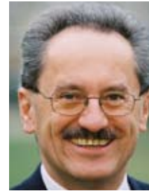
Oberbürgermeister Christian Ude , Präsident des Deutschen Städtetages

Umweltschutz in der Stadt ist einer der Schwerpunkte kommunaler Politik. Die Stadt erweist sich hierbei als umweltverträgliche Siedlungsform. In den Ballungsgebieten steht diese Siedlungsform für einen sparsamen Umgang mit dem Boden und für kurze Wege zwischen Wohnung, Arbeitsstätte, Einkauf, Kultur und Freizeit.