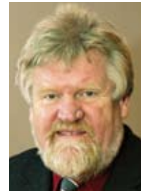
Alfred Buß , Präses der Evangelischen Kirche von Westfalen

Wir wünschen uns, dass die im Kirchenamt der EKD gemachten positiven Erfahrungen weitere Organisationen dazu veranlassen, sich an EMAS zu orientieren und für die Bewahrung der Schöpfung zu engagieren. ■