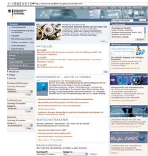
Bundeswirtschaftsminister Glos unterstützt die Kampagne zum Europäischen Umweltmanagementsystem (EMAS). www.bmwi.de/BMWi/Navigation/wirtschaft.html

entwickelt. Um die Bereitschaft zur Einführung von EMAS zu erhöhen, haben viele Bundesländer Anreize für eine Teilnahme geschaffen. So werden EMAS-Betrieben u. a. neben Erleichterungen im Vollzug des Umweltrechts auch Gebührenermäßigungen, z. B. in immissionsschutzrechtlichen Genehmigungsverfahren gewährt.